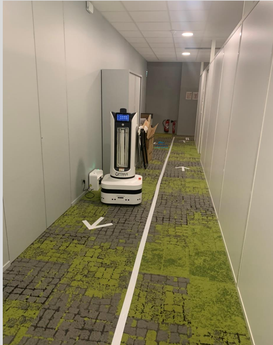
Programmation –Ecran de contrôle