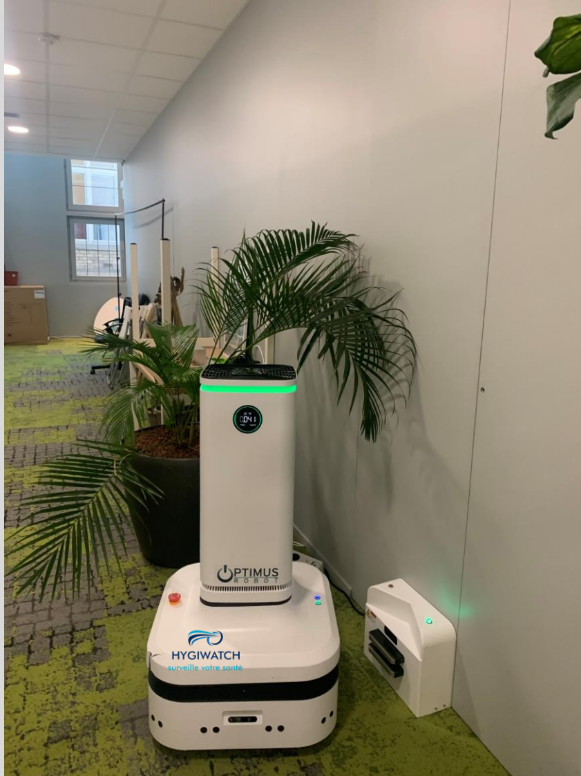
Affichage qualité de l'air